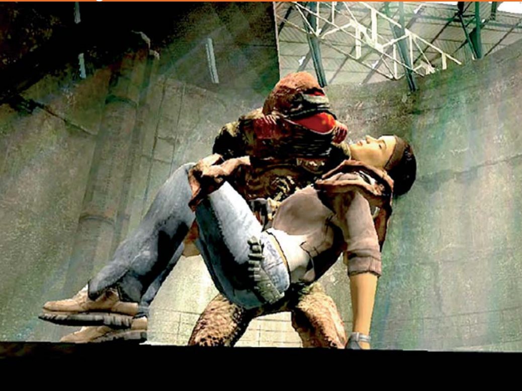
Nette Kollegen: Einst waren die Vortigaunts Feinde, jetzt verstehen wir uns bestens. Hier bringt einer unsere Begleiterin Alyx in Sicherheit.