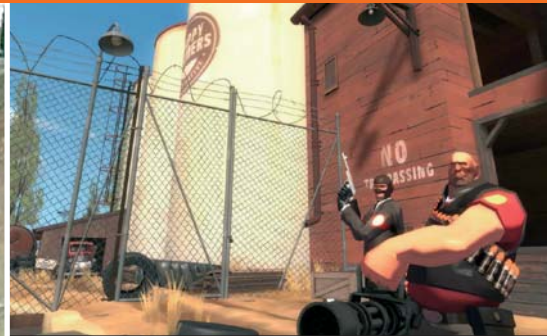
Vielfalt: Hier sieht ihr zwei der Einheiten von Team Fortress 2. Jede hat ihre Vor- und Nachteile.